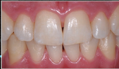
Paziente di 19 anni colore rilevato A2 Scala Vita*