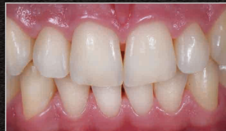
Controllo al termine del trattamento. Colore finale ottenuto più chiaro di A1 Scala VITA*

Vita ® è un marchio registrato di Vita Zahnfabrik H. Rauter mbH & Co. KG, Bad Säckingen - D)