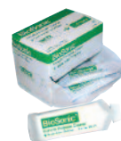
Soluzione antiossidante Super Concentrato