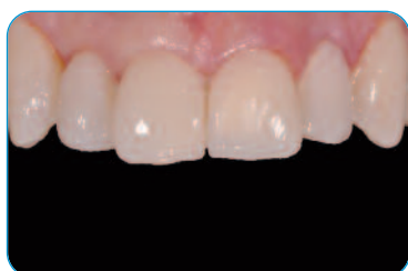
Cementazione dei provvisori