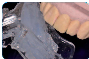
Impronta (indurimento 1 min. 30 sec)