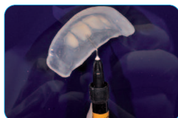
Applicazione del Flow HRi*