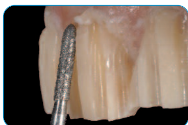
Preparazione sui provvisori