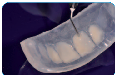
Flow HRi* Polimerizzazione (60 sec)